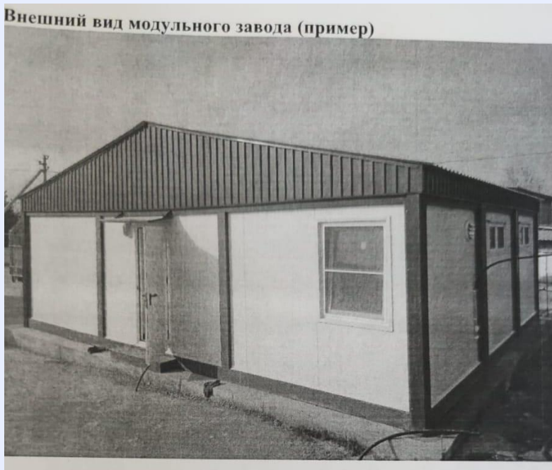
Внешний вид модульного завода (пример)