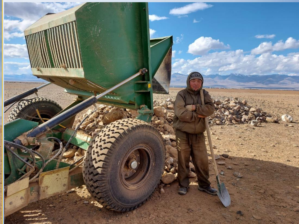
Межпоселенческая Мухор-Тархатинская оросительная система